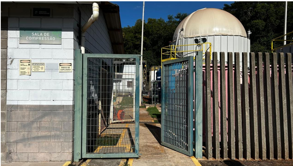
Portão de acesso entre posto de combustível e área de produção de Biogás. Portão com 2,600 x 2,20m.